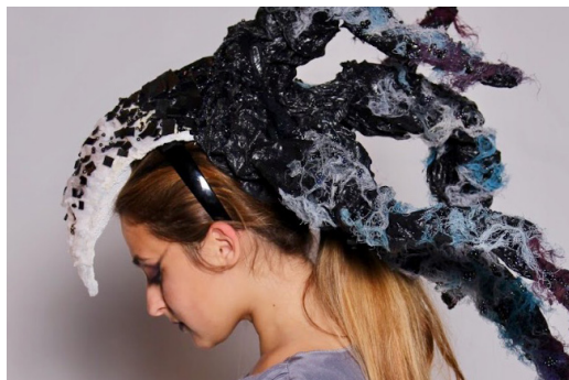
Trabalhos realizados por alunos da Escola Artística de Soares dos Reis, na disciplina de Projeto e Tecnologias