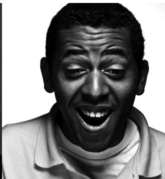
Trabalhos realizados por alunos da Escola Artística de Soares dos Reis, na disciplina de Projeto e Tecnologias